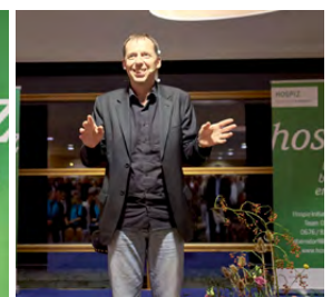
INGO VOGL - KABARETT